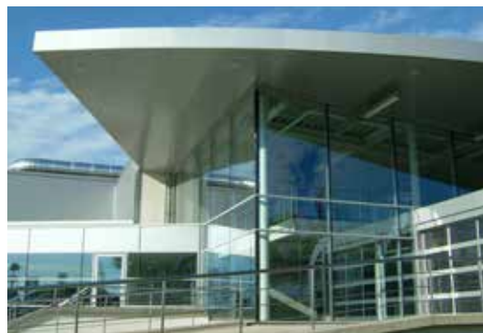
Bildrechte: Pasmos ZT GmbH Architekt Peter Eichberger